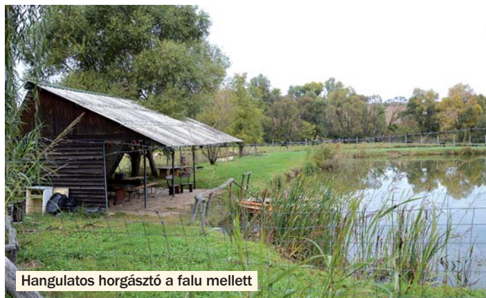
Hangulatos horgásztó a falu mellett

tuk erre az előző évben, de az ehhez szükséges másfél millió forint önerő meghaladta a falu lehetőségeit, így kénytelenek voltak visszamondani. A korszerű játszótérről tehát nem mondtak le, továbbra is a terveik közt szerepel.