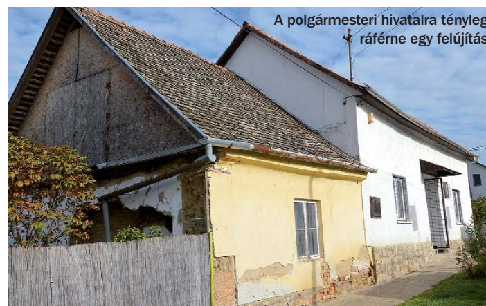
A polgármesteri hivatalra tényleg ráférne egy felújítás