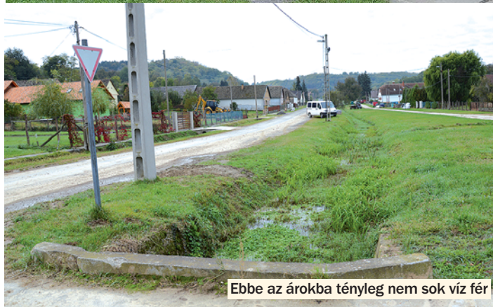
Ebbe az árokba tényleg nem sok víz fér