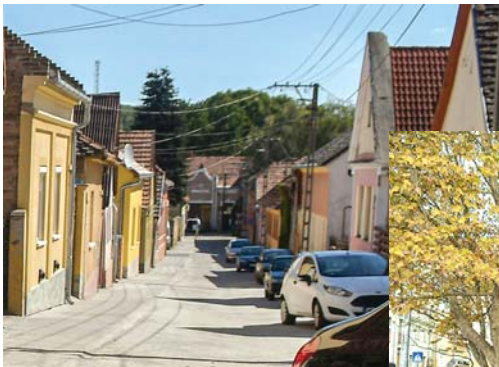
A József Attila utca teljes felújítása is kész