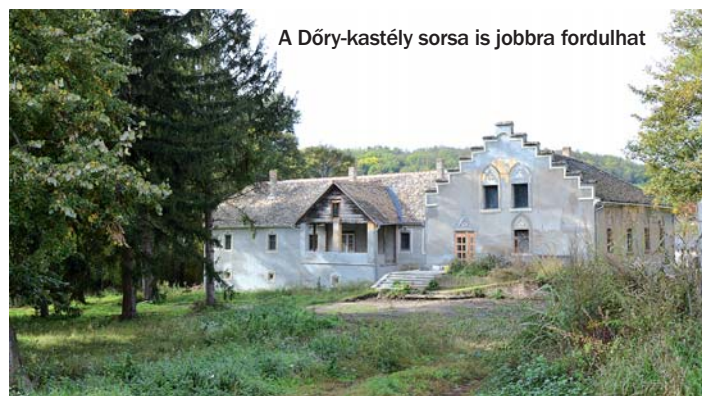
A Dörý-kastély sorsa is jobbra fordulhat

További eredmény, hogy a Kosuth utcai hid felújítása és a beszakadt pince tömedékelése vis maior pályázat útján megtörtént, mint ahogy a Mucsi-Hidas patak kotrása is lezajlott. Utóbbi azért volt fontos, mert az iszappal feltöltődött, növényzettel benőtt patak nem tudta elvezetni a csapadékvizet, nagyobb esőknél a sáros víz elöntötte a falu egy részét, és az iszap eltömítette a korábban kikortort árkokat is. A gond most az, hogy a Mucsi-Hidas patakba bevezető árkokat kellene újra ki-mélyíteni, de erre pillanatnyilag nincs pályázati lehetőség.