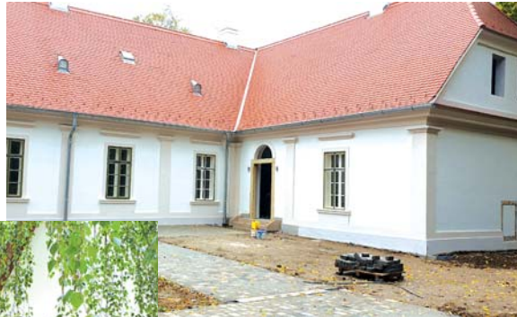
Hamarosan kész a Perczel-kúria