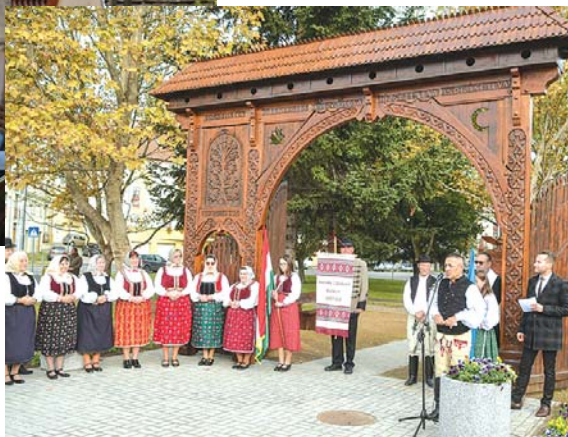
Felavatták a Székely Emlékparkot

tük el. Sokan és sokat dolgoztunk azért, hogy megszépüljön a terület, méltó környezetet kapjon az emlékpark. Ennek megvalósításában – mint oly sok mindenben – Potápi Árpád János nemzetpolitikáért felelős államtitkára, országgyűlési képviselőnkre is számíthattunk, a koordinációt pedig a Bukovinai Székelyek Országos Szövetsége vállalta fel. Ez a példa is jelzi, hogy minden segítséget megadunk az itt működő civil szervezeteknek, nekik is nagyban köszönhető, hogy színes és sokoldalú Bonyhádon a közös-