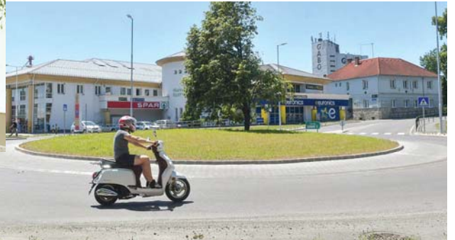
Elkészült a körforgalom