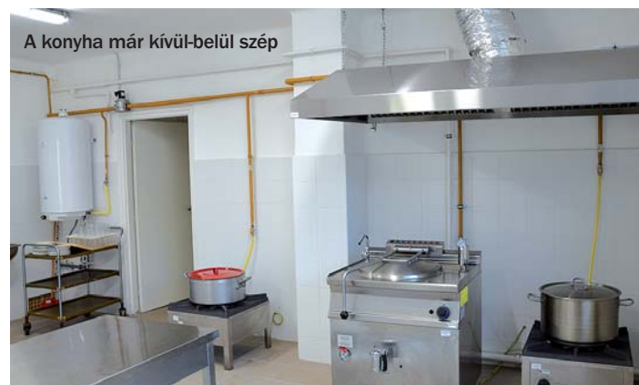
A konyha már kívül-belül szép