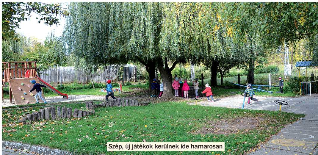
Szép, új játékok kerülnek ide hamarosan

Jó hír viszont, hogy a Dörý-kastélyt megvette valaki, és elkezdte a felújítást. A falu legismertebb épülete egyben szegényfoltja is volt Kisdorognak, nem volt szép látvány az elhanyagolt, romos épület a művelődési ház mellett. Persze, az önkormányzat is szívesen tett volna valamit, de a kastély megvásárlása és főleg a felújítás költségei meghaladták a falu lehetőségeit.