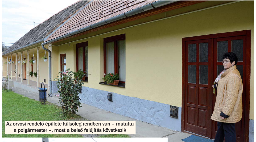
Az orvosi rendelő épülete külsőleg rendben van – mutatta a polgármester –, most a belső felújítás következik

Játszóterre is pályáztak – újra. Volt ugyanis egy nyertes pályáza-