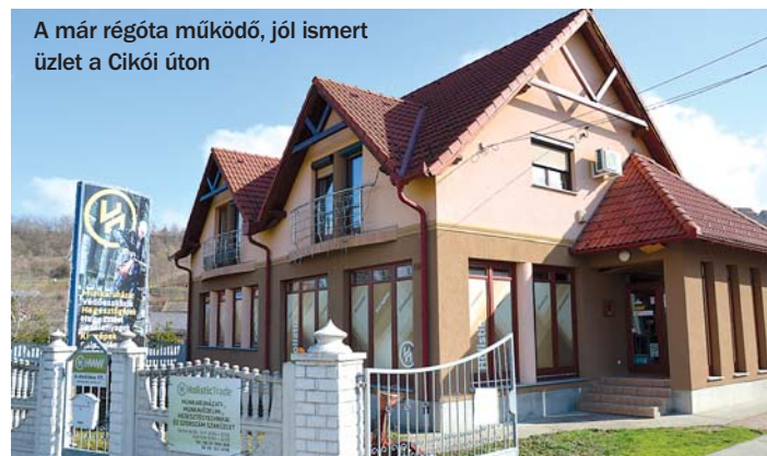
A már régóta működő, jól ismert üzlet a Cikói úton