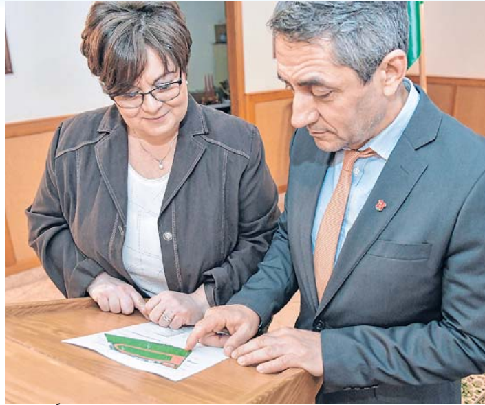
Potápi Árpád János Filóné Ferencz Ibolya a sajtótájékoztatón

A város vezetése az elmúlt időszak kiemelt feladatának tekintette, hogy minden pályázati lehetőséget kihasználva véghezvigye legfontosabb fejlesztési terveit, Bonyhád jövője érdekében. A Kormányhoz intézett ké-