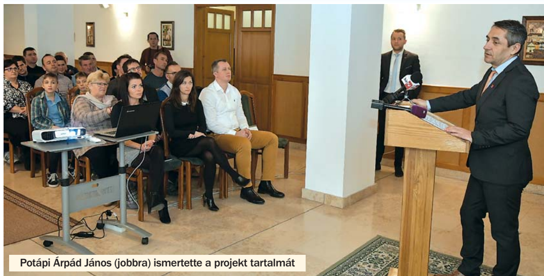
Potápi Árpád János (jobbra) ismertette a projekt tartalmát

BONYHÁD Magyarország Kormányának támogatásával megújul a bonyhádi önkormányzat tulajdonában lévő városi sportpálya, a Perczel Mór utca 44. szám alatti épület pedig sport rekreációs funkciót kap a jövőben. Mindezek megvalósítására 1 milliárd 567 millió 180 ezer forint célzott támogatást biztosít a Kormány a völgyeségi városnak. A döntést 2019. február 13-án jelentette be sajtótájékoztatón Potápi Árpád János, a Miniszterelnökség nemzetpolitikáért felelős államtitkára, a térség országgyűlési képviselője és Filóné Ferencz Ibolya, Bonyhád polgármestere.