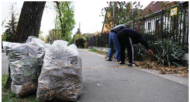
Lomtalanításkor az elektronikai hulladékot, például a tévét nem szállítják el. A fűvet, lombot megfelelő zsákokba kell gyűjteni (a képek illusztrációk)