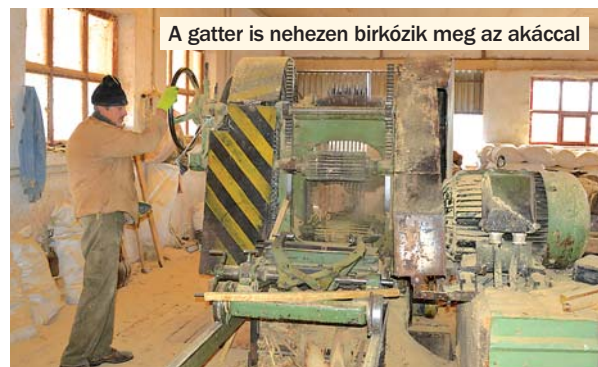
A gatter is nehezen birkózik meg az akáccal