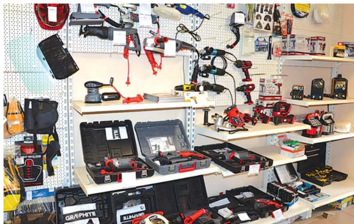
A Cikói úti üzlet kínálatából: gépek, szerszámok, munkaruházat