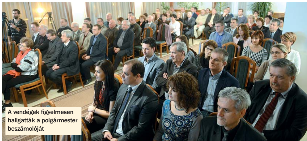
A vendégek figyelmesen hallgatták a polgármester beszámolóját

A város vezetője kiemelte még a több mint 500 kilowattos naperőmű-park építésére beadott pályázatukat, amelyeknek egyik lényeges momentumta, hogy az előkészítés során – a térség fejlődését szíven viselő járási központként – valamennyi, Völgységben levő települést megszólítottak, és 15 ön-