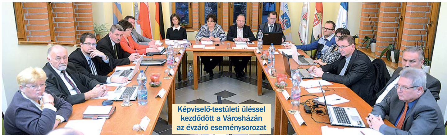
Képviselő-testületi üléssel kezdődött a Városházán az évzáró eseménysorozat

Minden kedves olvasónknak meghitt, szép karácsonyt és egészségben gazdag, boldog új évet kívánunk!