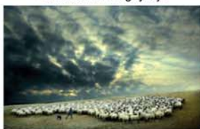
A Bonyhádi Fotóklub kiállító tagjai:

A Bonyhádi Fotóklub kiállításának megnyitója