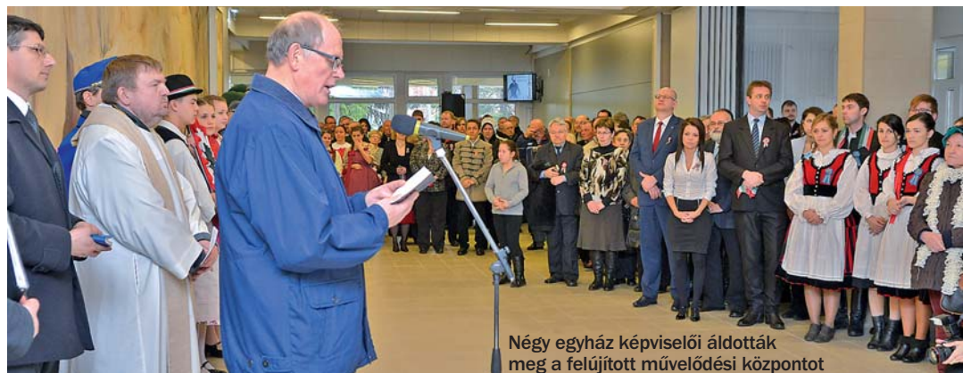
Négy egyház képviselői áldották meg a felújított művelődési központot

A színházteremben a Völgység Néptáncgyűttes fergeteges műsorával zárult az ünnepség, amelyet vastappsal jutalmazott a közönség. Végül a Rády József Huszárbandérium és a Magyar Nemzetország vezetésével az ünneplő sokaság átvonult a Kálvária-dombra, s leróta kegyeletét Perczel Mór honvédtábornok sírjánál.