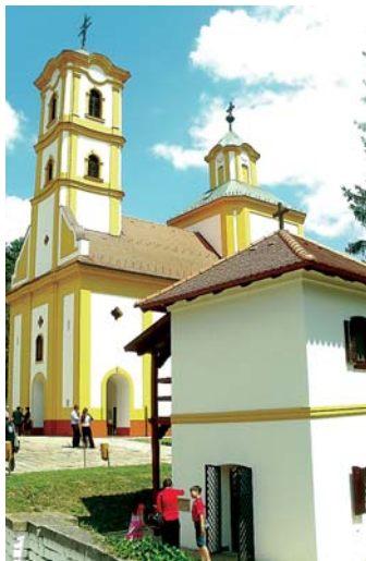
Gyönyörű a görögkeleti templom és a szintén nemrég felújított kútház