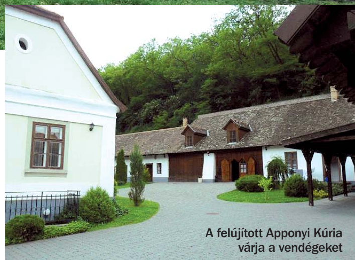
A felújított Apponyi Kúria várja a vendégeket

Bábaapáti lakosai nemcsak az ingyenes kábeltvé miatt vannak irigylésre méltó helyzetben. A gyönyörű környezetben fekvő faluban élők a kiválóan működő intézmények, a szép épületek, a rendben tartott közterületek mellett sokféle ellátást, szolgáltatást vehetnek igénybe. A fiatal családok például igényelhetnek kedvező bérleti díjjal önkormányzati bérlakást, amíg saját ingatlanba