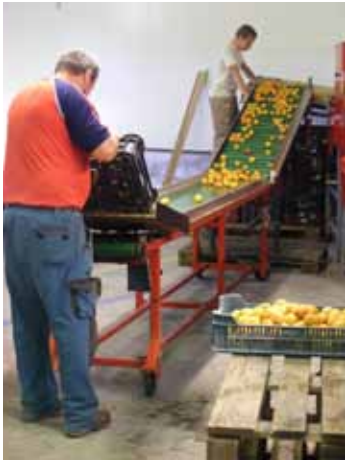
Osztályozzák a termést

A szociális szövetkezetek olyan személyek autonóm társulásai, akik önkéntesen egyesülnek abból a célból, hogy közös gazdasági, társadalmi, oktatási és kulturális céljaikat együttműködésben, demokratikusan irányított vállalkozásuk útján valósítsák meg.