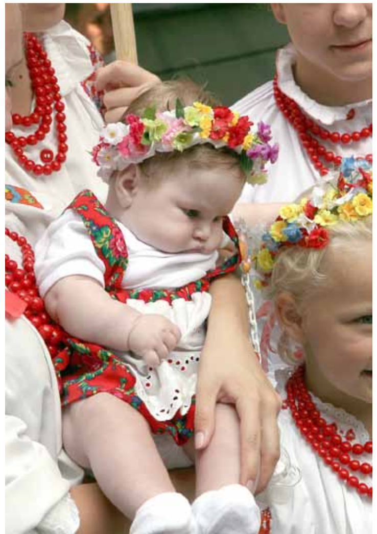
A tavalyi fesztivál legfiatalabb résztvevője