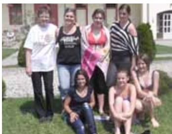
A győztes győrei csapat

Az idei évben az izményi Hegyhát Erdei Iskola adott helyet a Vöröskereszt által szervezett iskolai találkozónak.