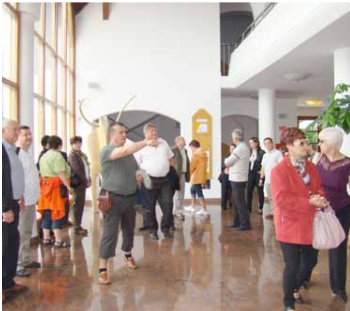
A lendvai Kultúrházban a társulás polgármesterei

A Völgységi Töbfcélú Kistérségi Társulás polgármesterei, jegyzői, valamint munkaszervezete közel húsz fős csapata tanulmányúton vett részt a szomszédos Szlovéniában. Az utazás fő célja a muravidéki magyarság életével, valamint a szlovéniai falusi turizmussal és turisztikai fejlesztésekkel való megismerkedés.