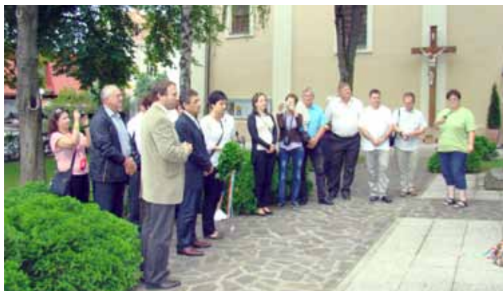
Koszorúzás Lendván a Szent István-szobornál