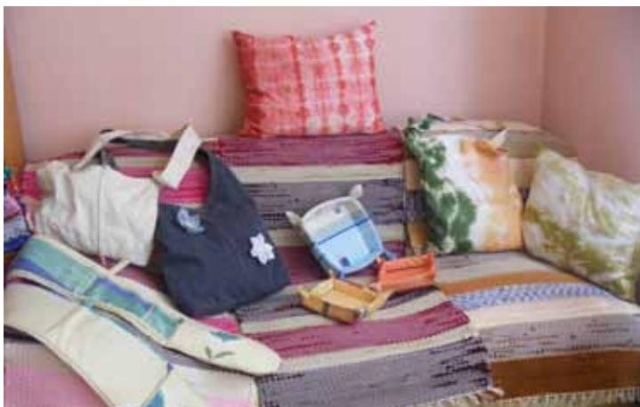
Az intézmény foglalkoztatottainak munkái

Legfontosabb jövőbeni feladatuknak, az intézmény férőhelyének bővítését tekintik. Ennek az alapja a családok részéről jelentkező megnövekedett igény. Istenes T.