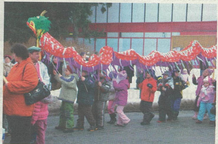
Jelmezbe öltözött gyerekek és felnőttek sokasága vonult fel a Bonyhádi Német Kisebbségi Önkormányzat által szervezett Városi Farsangon, a belvárosban.