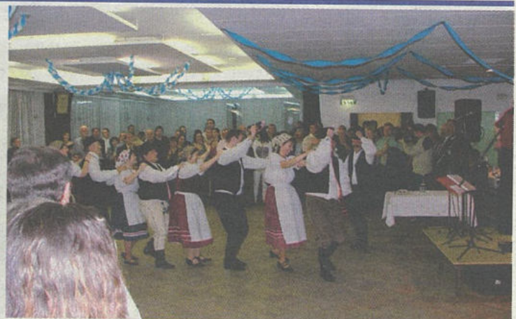
Az idei bonyhádi Székely Bálon több mint ötszázan mulattak a Művelődési Házban.