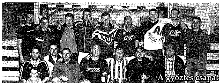
A győztes csapat

Öregfiúk: Az öregfiúk tornán a hat résztvevő körmérkőzést játszott egymással, melynek végén a Cá-Fa Plasztik öregfiúk gárdája megvédte címét. Mögöttük a Budapest Erőmű és a Ferplast-Széplaki csapata végzett a dobogón.