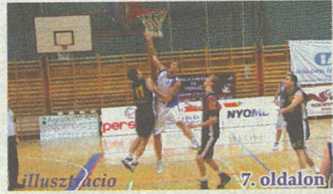
illusztráció 7. oldalon