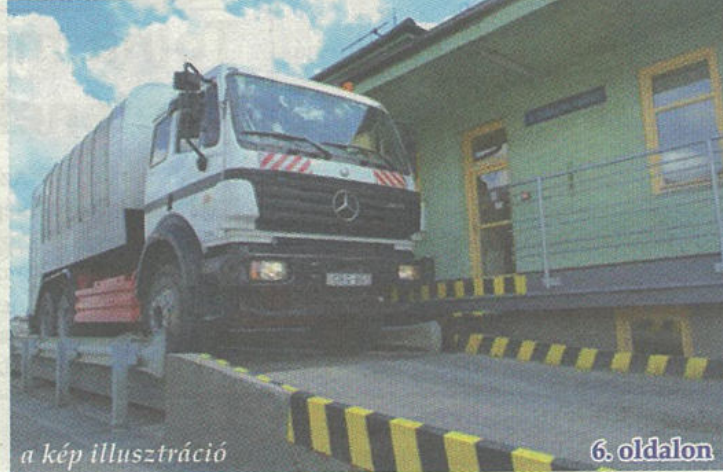
a kép illusztráció